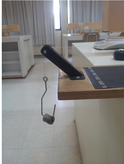
Figura 2: Gancho con golillas