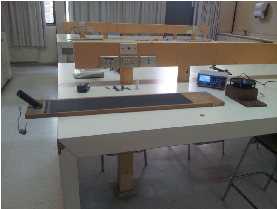
Figura 1: Disposición de Materiales