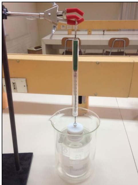
Figura 3.1: Montaje experimental Principio de Arquímedes.

Para analizarlo de forma práctica se considera un vaso con agua sobre una balanza, en la que se sumerge un cuerpo (sin que toque el fondo ni las paredes) como en la figura 1.