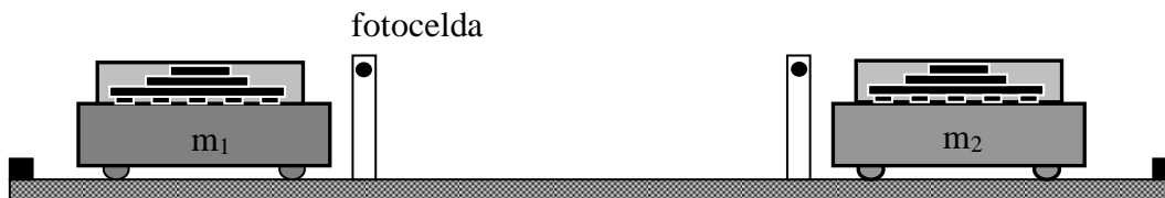
Figura 4.1. Sistema de cuerpos. Montaje experimental.